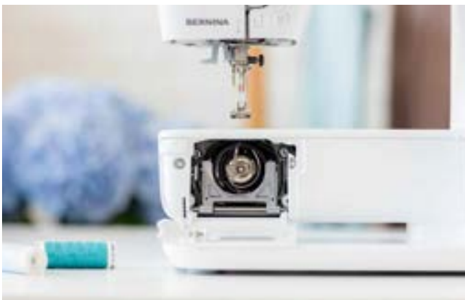
Bediening aan de voorkant bij het vervangen van de spoel