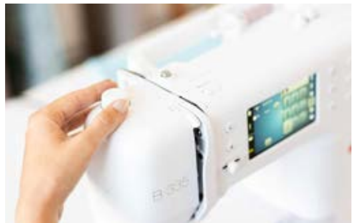
Naaivoetdruk individueel in te stellen