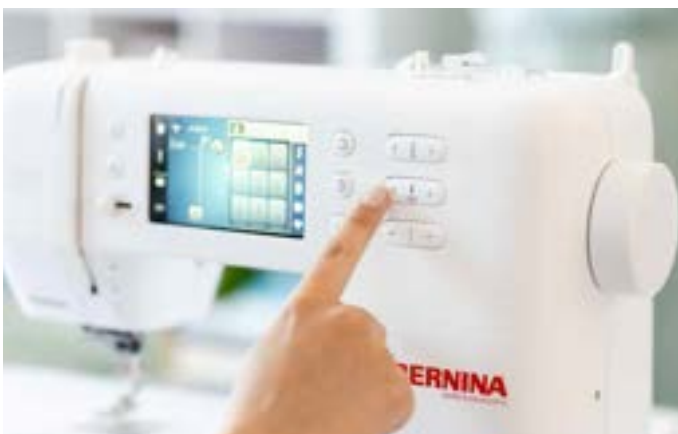
Eenvoudige bediening via touchscreen en snelkeuzetoetsen