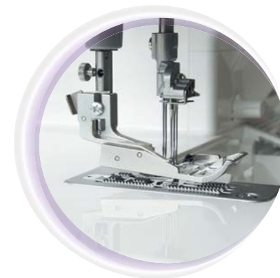
Extra grote voetlichting van 6 mm