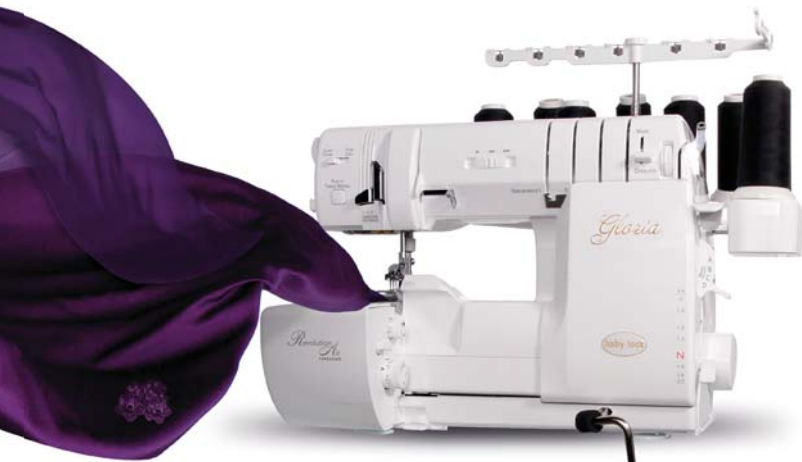
Geactrooieerd baby lock ATD-System

Optimaal naairesultaat met allerlei stoffen