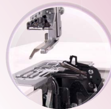
Stevige grijperkanalen met inklapbare hulpgrijper