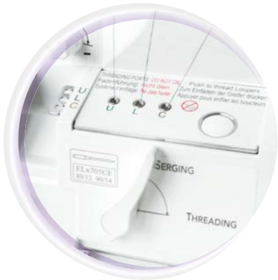
RevolutionAir™ Threading System met automatisch inrijgende grijpers