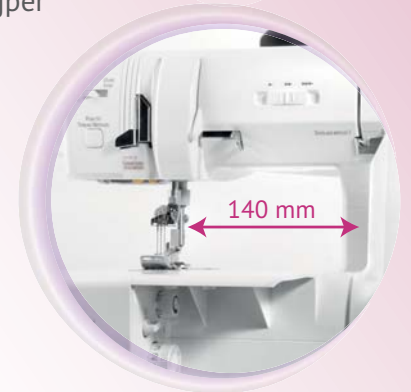
Snelheidsregeling en bijzonder brede doorlaat