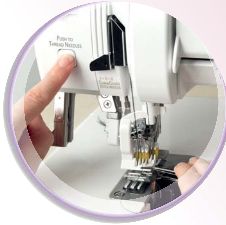
RevolutionAir™ Threading System voor het eerst een coverlock met automatisch inrijgen

Optimaal naairesultaat met allerlei stoffen