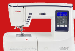
SKYLINE S3 AE