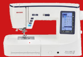
SKYLINE S7 AE