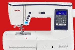
SKYLINE S5 AE