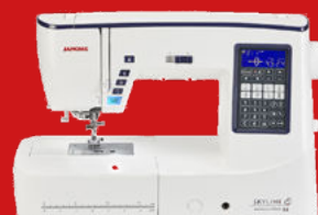
SKYLINE S6 AE