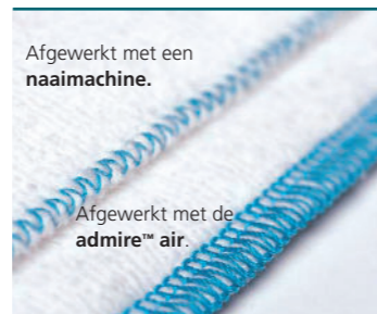
Afgewerkt met een naaimachine.

Supersnel naait de PFAFF® admire™ air 5000 de stof aan elkaar waarbij tegelijkertijd de stofrand keurig wordt afgewerkt en overtollige stof wordt afgesneden. Met deze lockmachine verwerkt u snel en perfect stoffen voor bijvoorbeeld sportkleding, maar ook gebreide stoffen, jersey stoffen of organza. Het extra comfort dat u heeft zit 'm in het innovatieve inrijgen van de grijperdraden met behulp van lucht. Nog nooit ging het inrijgen zo snel!