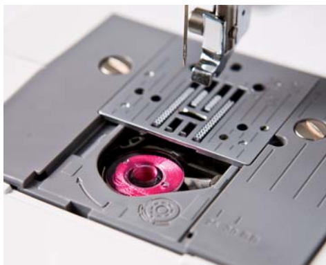
Snel verwisselbare spoel